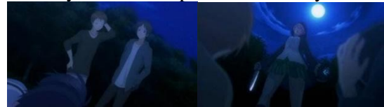
Para remaja membuat Shio pingsan (Kiri) Satou yang marah kepada remaja (Kanan)

Pada saat itu Satou memakai persona gadis yang lemah sehingga membuat para remaja tersebut lengah dan mendekatinya untuk menggoda Satou. Namun shadow yang ada pada diri Satou muncul dan melumpuhkan kedua remaja tersebut dengan senjata yang dia sembunyikan dibalik pohon sebelumnya.