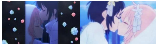
Satou dan Shio melakukan sumpah cinta (kiri) Satou dan Shio melakukan pernikahan (kanan)

Matsuzaka Satou terlihat sangat mencintai dan menyayangi Shio. Hal tersebut terlihat pada rasa sayangnya terhadap Shio yang amat besar sehingga membuat Satou ingin hidup bersama dengan Shio selama-lamanya tanpa adanya gangguan dari pihak lain. Bentuk cinta yang dimiliki oleh Satou terlihat beda dengan bentuk cinta seorang ibu yang menyayangi anaknya dikarenakan Satou melakukan sumpah cinta dan menikah dengan Shio meskipun pernikahan itu berlangsung diantara mereka berdua saja.