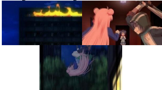
Bibi yang membakar apartemen (kiri) Perseteruan Satou dan Asahina (kanan) Satou melindungi Shio (bawah)

tersebut dan berhasil menemukan Shio yang sedang bersama dengan Satou.