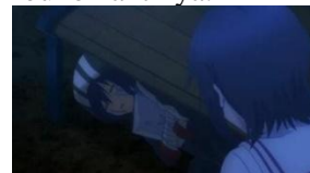
Asahi tidur di bawah kursi taman

Salah satu latar tempat yang sering muncul pada anime ini adalah taman yang tidak dijelaskan namanya. Kobe Asahi menggunakan tempat di bawah kursi taman sebagai tempat untuk tidurnya. Latar taman ini juga merupakan lokasi Shouko yang merupakan teman kerja Satou dan Asahina menjadi akrab di mana Asahina mendapatkan informasi keberadaan Shio melalui Shouko nantinya.