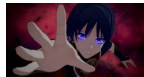
Kunikuzushi yg panik dan putus asa

2.8. Kunikuzushi kalah dari Nahida dan si Kembar setelah pertarungan 168 kali dalam Samsara (looping dreams) yang diciptakan oleh Nahida. Akibat kekalahan tersebut, robot Shouki no Kami yang Kunikuzushi tempati pun mulai hancur. Nahida merebut Gnosis milik Kunikuzushi sehingga menyebabkan dirinya menjadi "kosong" atau tanpa "hati". Kunikuzushi merasa tidak lagi memiliki alasan hidup karena Gnosis diciptakan untuk menjadi wadahnya. Kunikuzushi menyerah dan jatuh menghantam tanah dari ketinggian berates-ratus meter, yang menyebabkan kerusakan yang sangat parah dan koma.