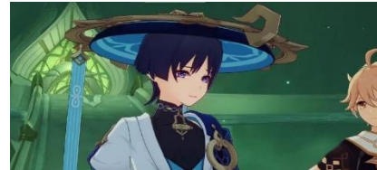
Sosok Kunikuzushi hilang ingatan

Tindakan Kunikuzushi tidak hanya menghapus ingatan dunia tentangnya, tetapi juga menghapus ingatannya sendiri sehingga dirinya berubah menjadi sosok yang polos dan lugu.