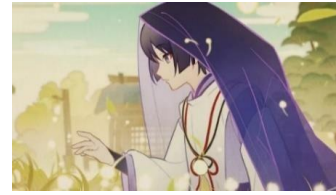
Gambar 3 Kunikuzushi sebagai Kabukimono

2.2. Kunikuzushi sebagai Kabukimono. Kunikuzushi diasingkan di Paviliun Shakkei Inazuma dan ditemukan oleh Katsuragi dan tinggal di desa Tatarasuna sebagai Kabukimono dan hidup seperti manusia umumnya namun berbeda dengan manusia dia hanya boneka yang tidak memiliki hati namun memiliki fisik yang cantik, anggun dan lembut. Kunikuzushi sebagai Kabukimono memiliki kebutuhan neurotik dimana dia menginginkan penerimaan dan kesempurnaan sebagai manusia.