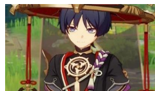
Gambar 1 Kunikuzushi

Tokoh Kunikuzushi seorang pengembara cantik dari Inazuma, anggota organisasi militer Fatui negara Snezhnaya yang kerap menimbulkan kekacauan di dunia sehingga Kunikuzushi dimusuhi. Kunikuzushi dikenal dengan nama Scaramouche, petinggi Fatui no.6 jabatannya sebagai Balladeer. Sebagai Scaramouche dia dikenal sosok yang kuat dan menakutkan. Ketidakpeduliannya terhadap manusia membuat dirinya dibenci oleh semua orang.