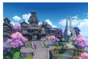
Gambar 2 Negara Inazuma

Negara Inazuma negara kepulauan, representasi negeri Jepang. Konflik utama negeri Inazuma diangkat dari sejarah asli Jepang waktu pemerintah menetapkan dekrit sakoku yaitu menutup negeri dari negara luar. Begitu juga Inazuma, Raiden Ei pemimpin Inazuma mengisolasi Inazuma dari dunia luar agar Inazuma aman dan abadi.