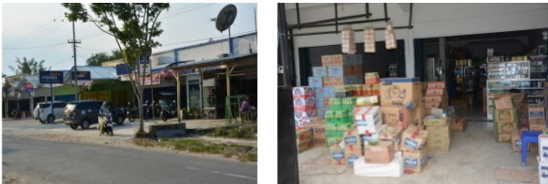
Gambar 2. Kawasan Perdagangan di Jalan Utama Koya Barat

Saat ini, lokasi hunian penduduk yang paling maju berada di wilayah Koya Barat dan Koya Timur yang menjadi konsentrasi pengembangan transmigrasi. Wilayah tersebut telah berkembang menjadi kawasan pemukiman yang paling besar di distrik itu dan sekaligus menjadi pusat perdagangan untuk mencukupi kebutuhan sehari-hari masyarakat sekitar distrik Muara Tami. Perkembangan ekonomi setempat didukung oleh infrastruktur jalan arteri provinsi yang baik, listrik, pasar dan sistem perbankan, menjadikan wilayah Koya Barat dan Koya Timur sebagai pusat orientasi utama bagi rumah-tangga penduduk di distrik dalam memenuhi kebutuhan sehari-hari mereka.